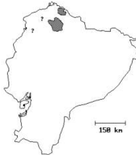
Mapa 2. Distribución actual del mono araña de cabeza café ( Ateles fusciceps ). Los signos de interrogación ("?") se han colocado en localidades que podrían tener alguna población aislada.

agricultura y ganadería. Se puede decir que en estos lugares la única evidencia de que en algún momento habitó A. fusciceps son los registros conservados en museos y documentados en publicaciones, pues resultó imposible encontrar personas que puedan comentar algo sobre la especie. Es posible que este primate haya desaparecido de aquellas zonas antes de la primera mitad del siglo XX. Según los datos obtenidos en las visitas de campo, los límites de distribución actual de este primate serían los siguientes ([Mapa 2]):