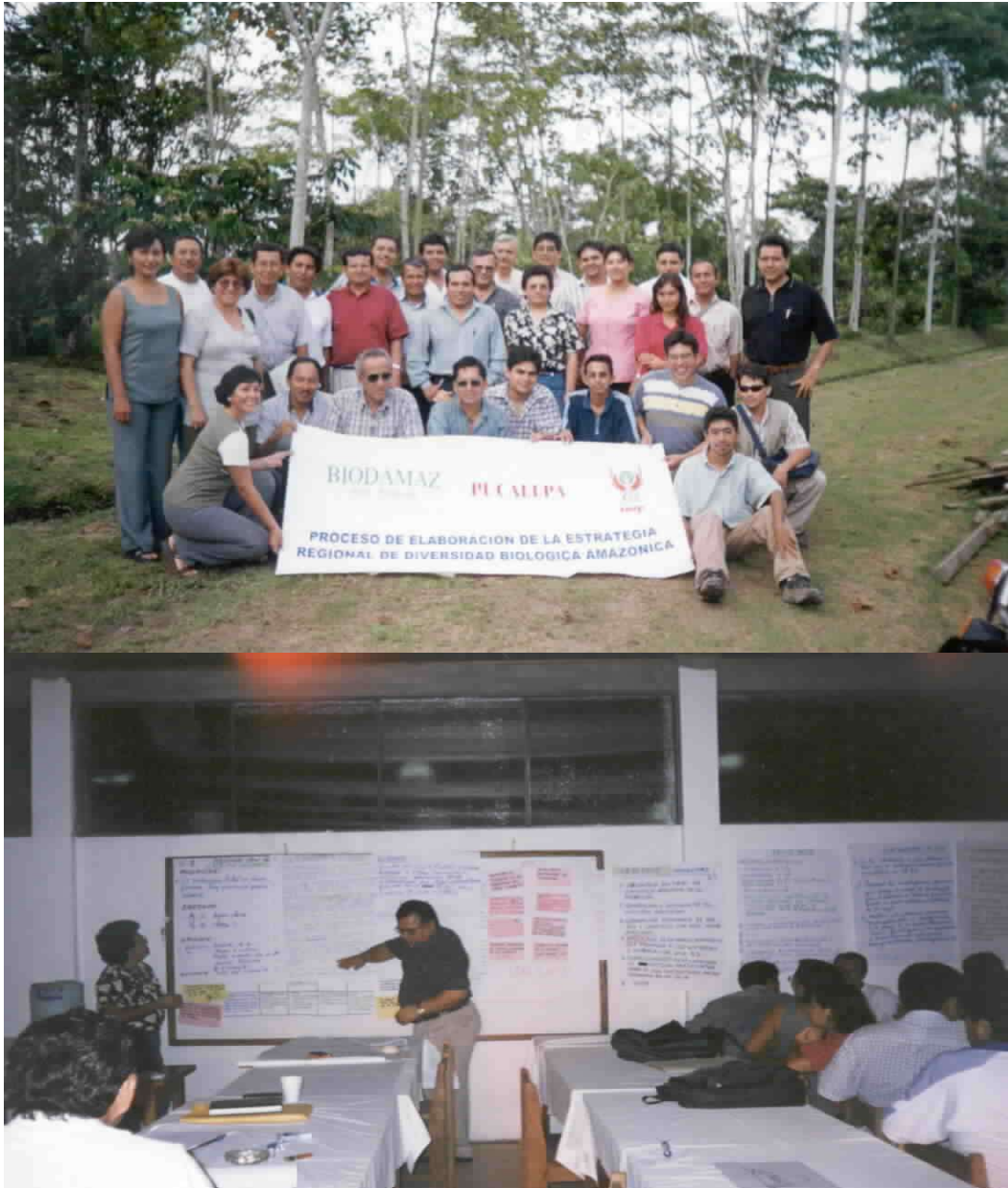
Participantes del Taller de consulta sobre la ERDBA realizado en Pucallpa Ucayali, Marzo 2001