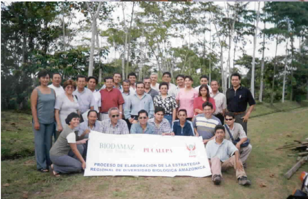
Participantes del Taller de consulta sobre la ERDBA realizado en Pucallpa Ucayali, Marzo 2001