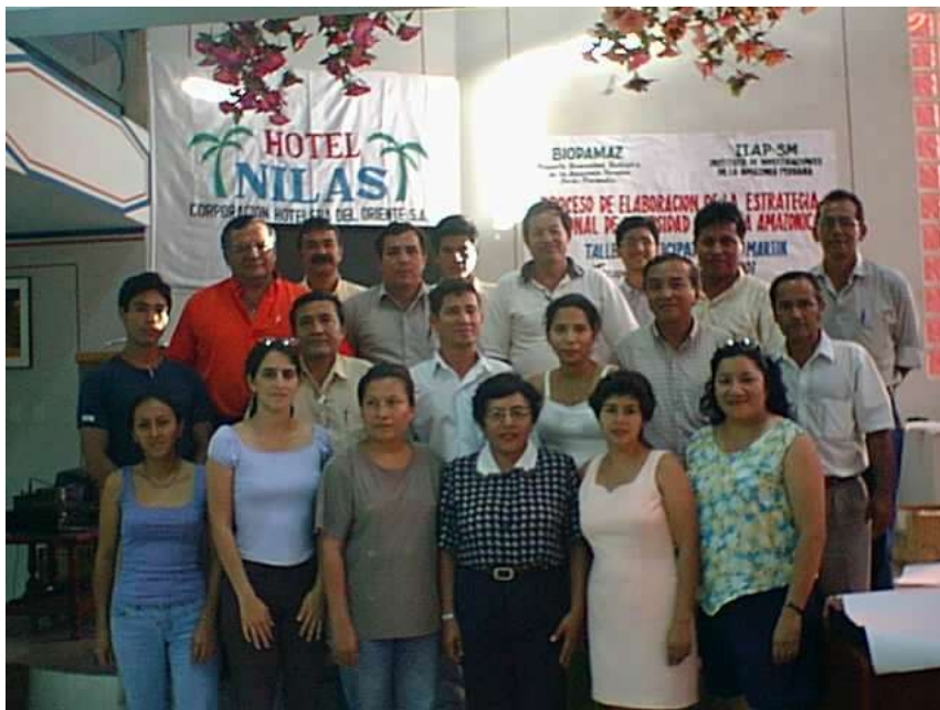
Participantes del Taller de consulta realizado en Tarapoto- San Martín, Marzo 2001 Mesa de trabajo en Taller de consulta de la ERDBA –Tarapoto, marzo 2001